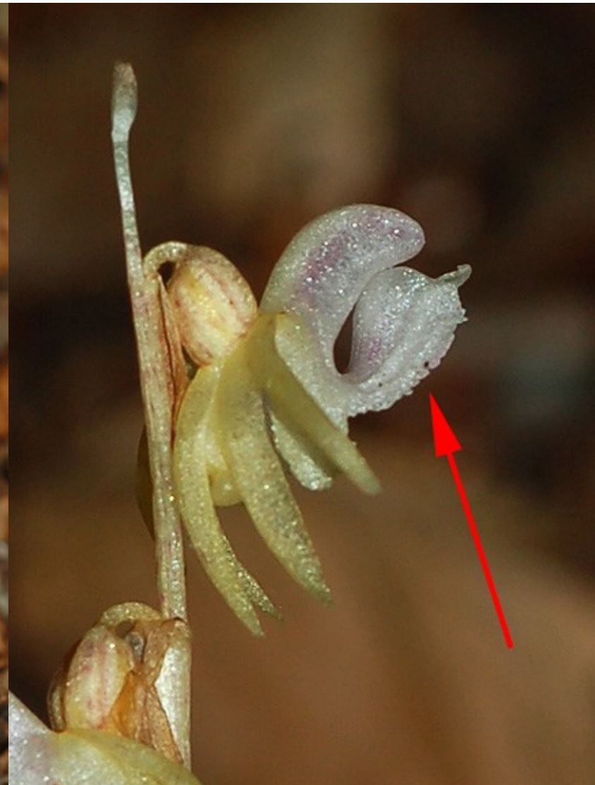
Foto 8: Epipogium aphyllum . Detalle de la flor en el que se aprecia el labelo no plano, y orientado hacia arriba.