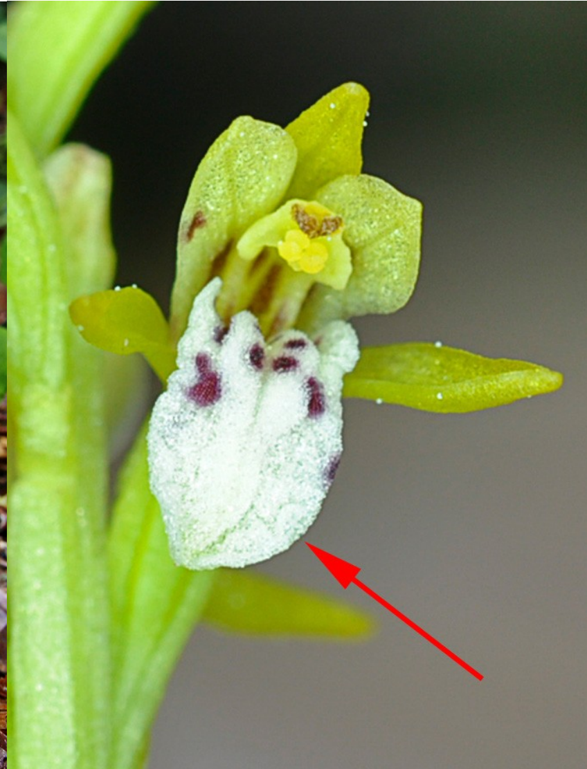
Foto 10: Corallorhiza trifida . Detalle de la flor en la que se señala el labelo , sin ninguna división.

(3b) Flores con el labelo dividido en dos..... Neottia Guett. (Una sola especie ibérica: Neottia nidus-avis (L.) Rich.)