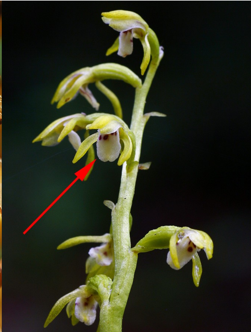
Foto 6: Corallorhiza trifida . Se aprecia el labelo de las flores, más o menos plano.

(2b) Flores con el labelo no plano y orientado hacia arriba..... Epipogium J.G. Gmel. Ex Borkh (Una sola especie ibérica: Epipogium aphyllum Sw.)