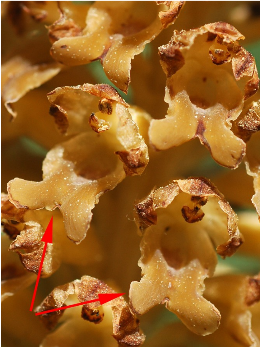
Foto 5: Neottia nidus-avis . Flores en las que se señala el labelo plano.

2.- (2a) Flores con el labelo más o menos plano..... 3